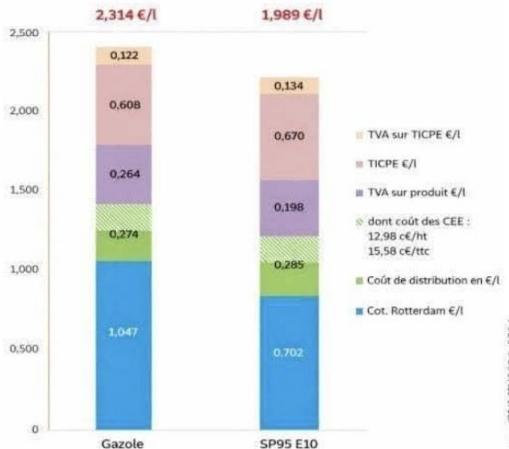
Décomposition des prix des carburants au 10 avr 2026

HALTE AU RACKET ! BLOCAGE IMMEDIAT DES PRIX A 1,20€ DU LITRE A LA POMPE ! SALAIRE MINIMUM A 2400€ ! LUTTER ET NON SUBIR ! VIVRE ET NON SURVIVRE !